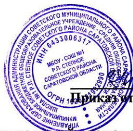
График посещения столовой